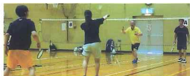
バドミントン大会