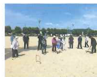
ゲートボール大会