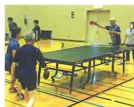
ラージボール卓球大会