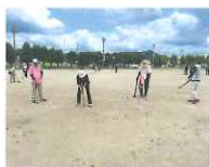
グラウンドゴルフ大会