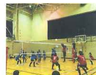
ビニールボール大会