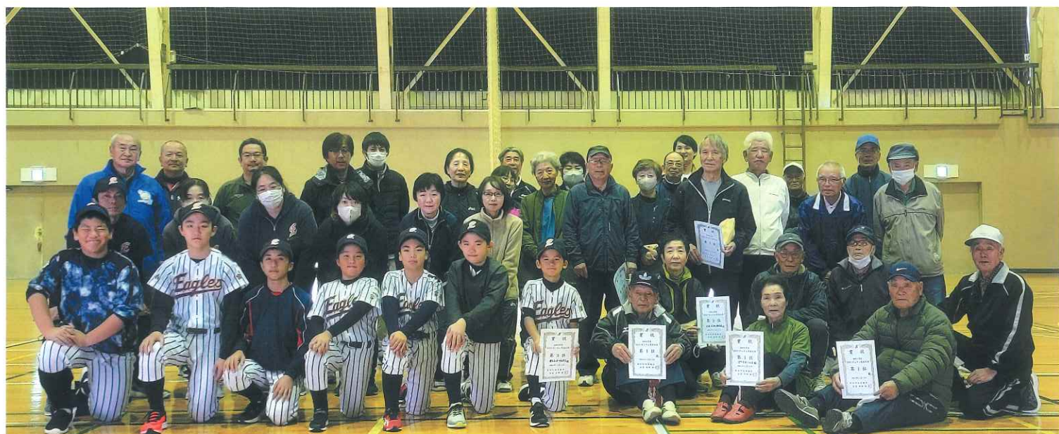
「ボッチャ交流大会」令和5年11月19日